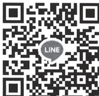
QR Code สำหรับผู้สมัคร สแกนเข้ากลุ่มไลน์