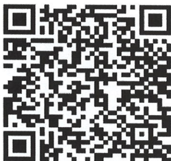
QR Code วิธีการลงทะเบียน และการรับสมัคร